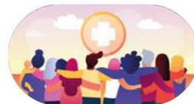
En tillgänglig sjukvård och jämlik hälsa