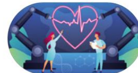
Säkerställd högspecialiserad vård i Östergötland