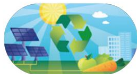
Ett aktivt miljö- och klimatarbete

Regionfullmäktige beslutade att fokusera på dessa områden i Treårsbudget 2022- 2024 med fokusområde 2022