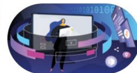
Digitalisering och ny teknik skapar nya möjligheter