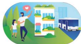
Hållbart resande, attraktiva livsmiljöer och konkurrenskraft