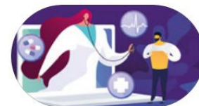
En nyskapande primärvård och nära vård