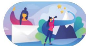
En attraktivare arbetsgivare